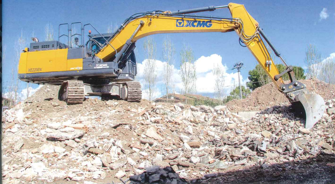
I macchinari dell'Ecologica Umbra

poi riconvertiti in nuovi utilizzi o per la produzione di nuova energia; dall'altra di limitare l'erosione dei materiali primari, limitando scavi ed estrazioni. Queste procedure vengono gestite dall'Ecologica Umbra tramite filiere ben dettagliate: dalle consulenze (anche mediatiche) alle analisi che veicolano poi