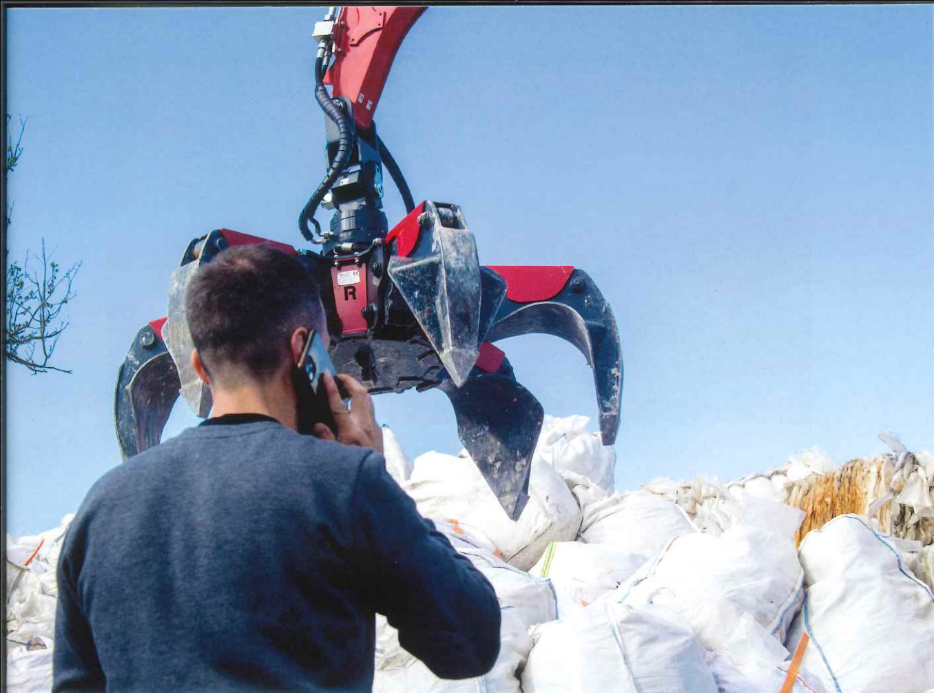
La gestione del deposito